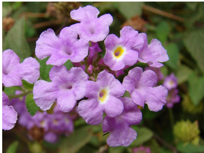
Figura 2. Flores de Lantana fucata Lindley. Detalhe das flores em antese caracterizadas pela cor amarela na região da fauce da corola.

As flores (Figura 2) encontram-se organizadas em inflorescências do tipo capítulo e cada inflorescência pode conter até oito unidades, porém somente duas entram em antese a cada dia. São de cor lilás (Figura 2), medem cerca de 1 cm de comprimento e 1 cm de diâmetro, são tubulosas e exalam odor suave e agradável. As flores em antese se diferenciam devido à cor amarela na região da fauce da corola (Figura 2). A antese é diurna e possui apenas um dia de duração, iniciando por volta das 6 horas e encerrando no final da tarde, por volta das 17 horas.